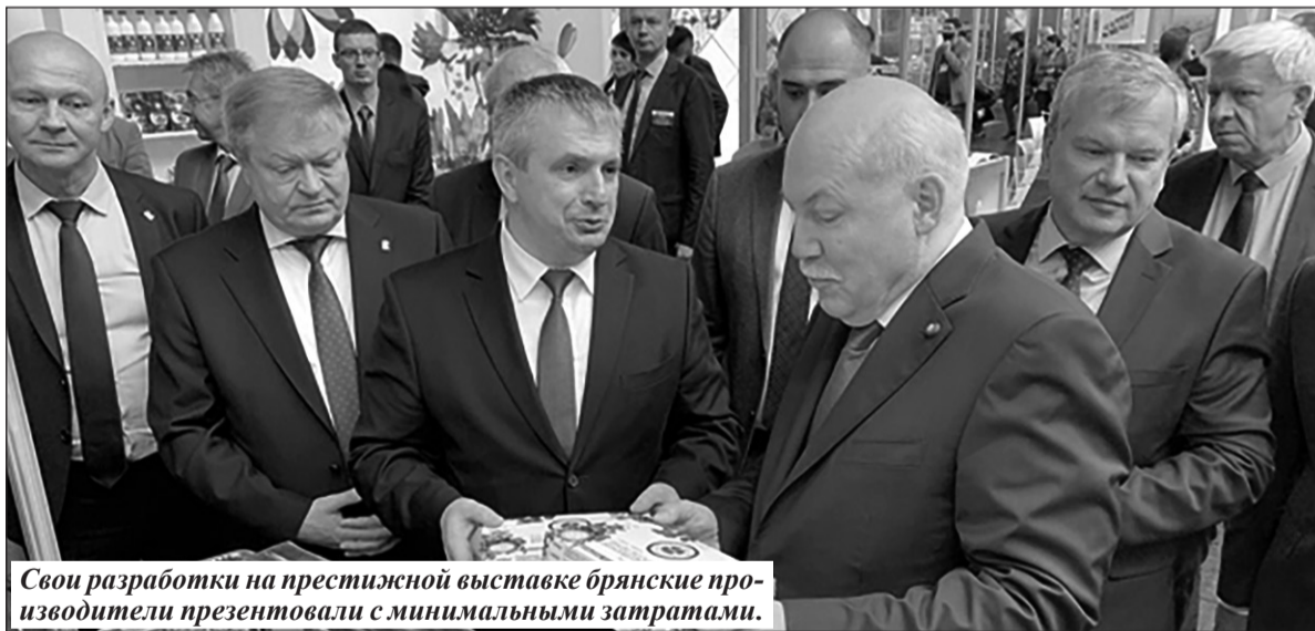
Свои разработки на престижной выставке брянские производители презентовали с минимальными затратами.

БРЯНСКИЕ ПРЕДПРИНИМАТЕЛИ ПРЕДСТАВИЛИ СВОИ ТОВАРЫ НА МЕЖДУНАРОДНОЙ ВЫСТАВКЕ В МИНСКЕ